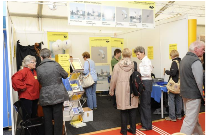
Stand der RGN am MAG

auch ganz herzlich bei den 40 freiwilligen, engagierten Mitarbeitern und Mitarbeiterinnen bedanken, welche während den vier intensiven Tagen unseren Stand betreut haben. Sie haben wesentlich zum Erfolg beigetragen!